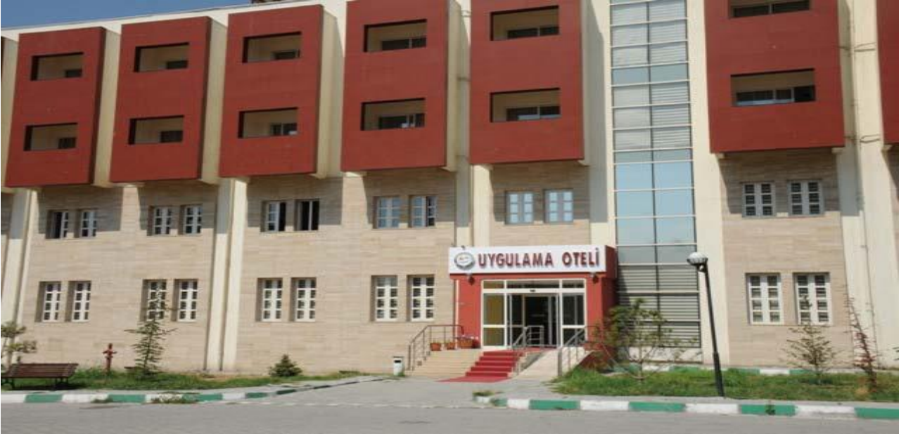
(Şekil 1): Uygulama Oteli

Uygulama Oteli, Iğdır Üniversitesi'nde turizm eğitimi alan öğrencilerimiz ile birlikte sizlere kaliteli hizmet sunmak, sizleri Uygulama Otelimizde kaldığınız süre zarfında dinlenmiş, rahatlamış bir şekilde uğurlamaktır. Uygulama Otelimiz yaz-kış sizlere hizmet vermektedir. Odalarımız geniş ve siz değerli müşterilerimizin konforu göz önünde bulundurularak dizayn edilmiştir. Kahvaltı salonumuzda sizi güne en iyi şekilde başlatacak kahvaltı hizmetini ücretsiz sunmaktayız. Lobimizde sohbet edebilir ve açık teraslarımızda dinlenebilirsiniz. İnternet hizmetimizden 24 saat yararlanabilirsiniz. 24 kişilik konferans salonumuzda her türlü toplantınızı yapabilirsiniz. Iğdır Üniversitesi Rektörlüğü bünyesinde hizmet veren Uygulama Oteli, şehrin en güzel manzaralarından biri olan Ağrı Dağı'nı görebilmekte olup, Iğdır Havalimanı'na olan uzaklığı 15 km, Şehir merkezine uzaklığı 1 km'dir..Uygulama otelimiz, 22 adet balkonlu , 22 adet balkonsuz oda olmak üzere toplam 44 odalı , 84 yatak kapasiteli bir uygulama otelidir.